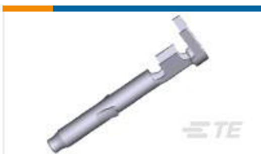
TE 产品编号170362-1 UNIV M-N-L SOC. 22-18 AWG