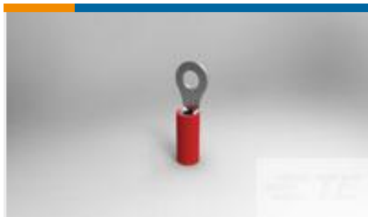
TE 产品编号130046 PIDG RING TONGUE