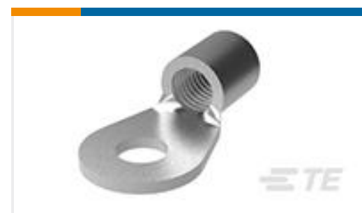
TE 产品编号2-1377172-1 SMP 0-0033465-0