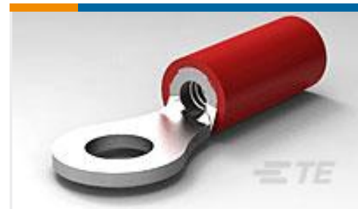
TE 产品编号170780-1 P.G RING UL.CSA(22-18)