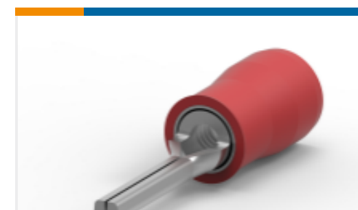
TE 产品编号2-1377174-5 SMP 0-0165590-1