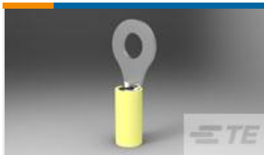
TE 产品编号 165034 PIDG RING 12-10 1/4