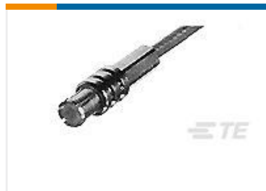
TE 产品编号1060875-2 MCX CABLE PLUG, CRIMP ATTACH