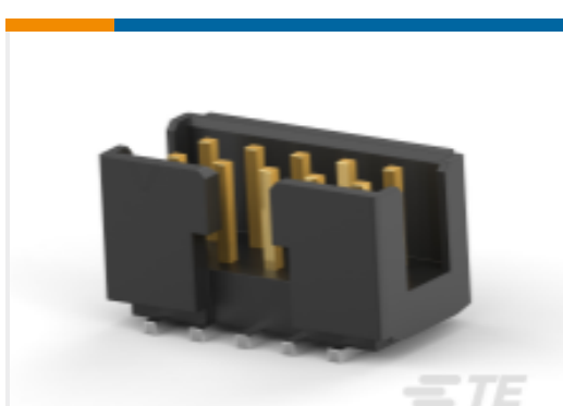
TE 产品编号1-2373376-0 10P,2MM,SHRD HDR,DRVT,SMD,0.1 AU,TB