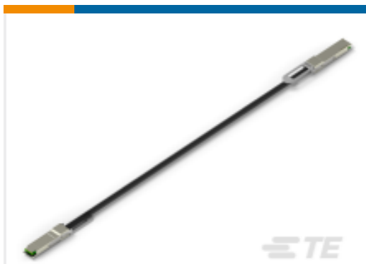
TE 产品编号2333393-3 30 AWG QSFP28 对 QSFP28 电缆组件