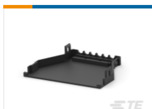
TE 产品编号1776695-1 Strain Relief, D5200, Dynamic