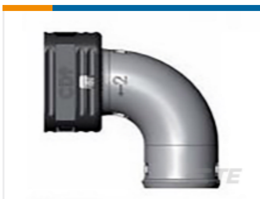
TE 产品编号ZPF000000000102764 787-8055-30M