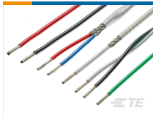
TE 产品编号262172-001 81044/6-14-2