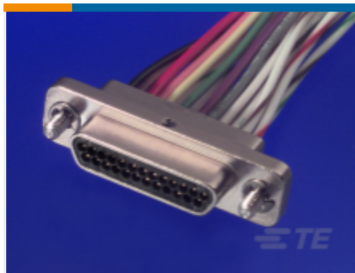
TE 产品编号2-1532176-7 M83513/04-F11C, MCKS-C2-B-37S6Q9-18.0