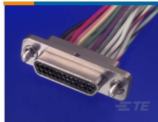
TE 产品编号2-1532172-7 M83513/04-B11C, MCKS-C2-B-15S6Q9-18.0