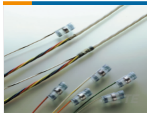
TE 产品编号626702N001 S02-20-R-6CS1093