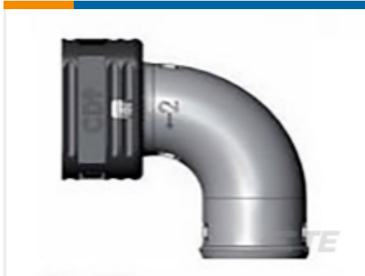
TE 产品编号ZPF000000000102764 787-8055-30M