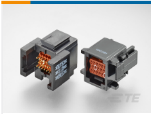
TE 产品编号ABC06N-22P IN-LINE PLUG