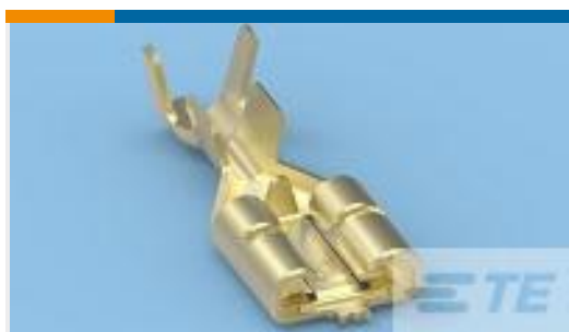
TE 产品编号1380089-1 PL MKIII L.I.F 250 REC>1.0/2.5 MM2 BR