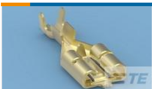
TE 产品编号1380088-1 PL MKIII L.I.F 250 REC 0.5/1.0 MM2 BR