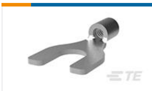
TE 产品编号8-322996-1 TERMINAL,SOLIS SPD 16-14 6