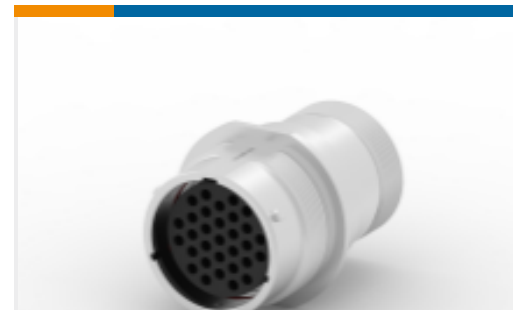
TE 产品编号HD34-24-31SE-072 REC, 31P, AL, E, THD ADPT, DRAIN, 16, S