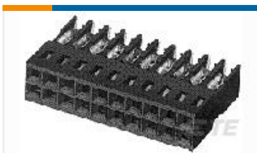
TE 产品编号7-102398-8 60 AMPMODU MT ASSY DR.100CL SN