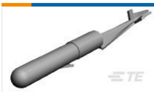
TE 产品编号61518-1 CMNL PCB PIN PTPHBZ