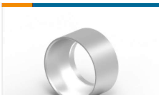
TE 产品编号2294655-1 SHIELDING FERRULE