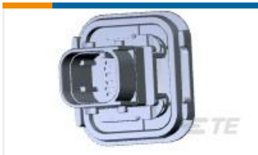
TE 产品编号4-1703808-1 4POS,TAB 2.8X0.8,TAB HSG,ASSY, CODD