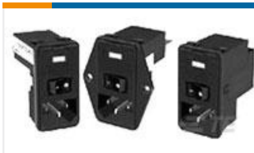
TE 产品编号6609101-1 PS000S000=C1001