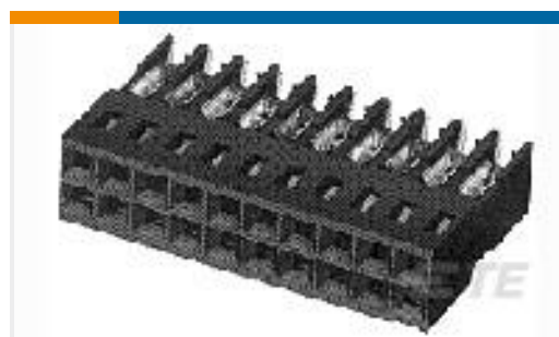
TE 产品编号102398-4 12 AMPMODU MT ASSY DR .100CL