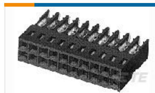
TE 产品编号2-102398-3 50 AMPMODU MT ASSY DR .100CL