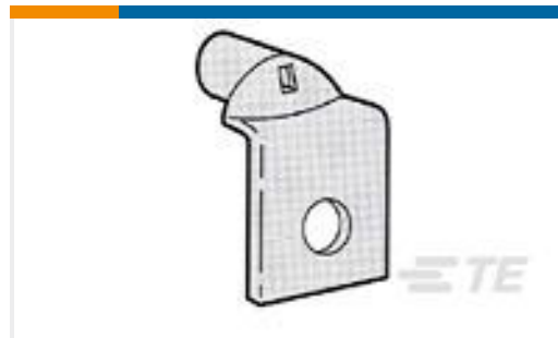
TE 产品编号696123-1 TERM,AMPOWER 4/0 5/8 90 NIPL