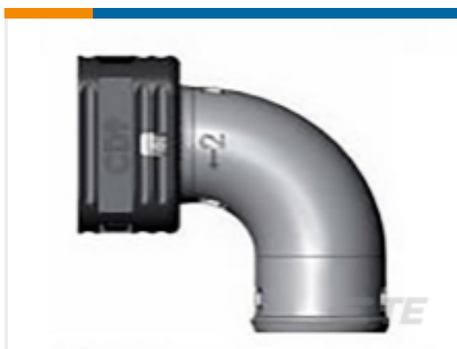
TE 产品编号ZPF00000000102764 787-8055-30M