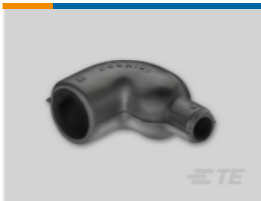
TE 产品编号806823-000 球形热缩护套：有嘴，直角