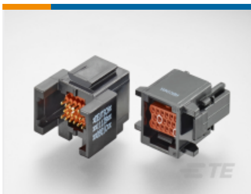
TE 产品编号ABC06N-22P IN-LINE PLUG