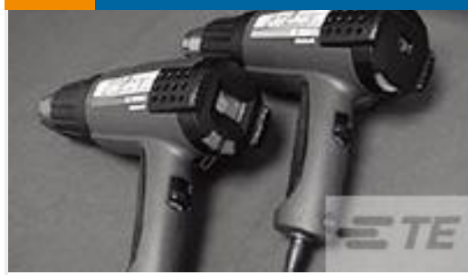
TE 产品编号 CJ2087-000 HL2010E-KIT-120V