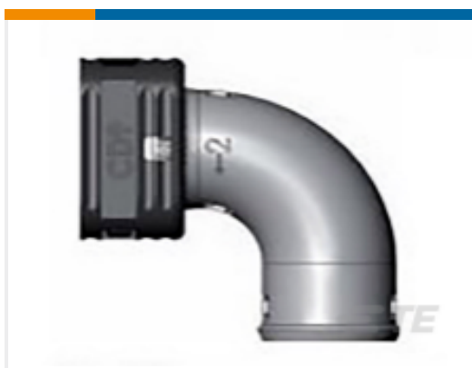
TE 产品编号ZPF000000000102764 787-8055-30M