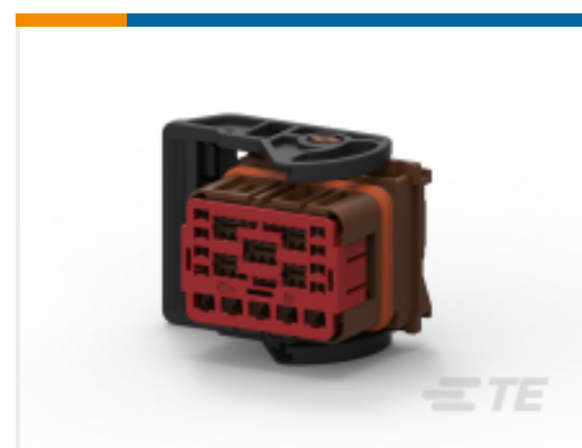
TE 产品编号6-2208804-2 53POS MIXED MOS REC SEALED COD 3