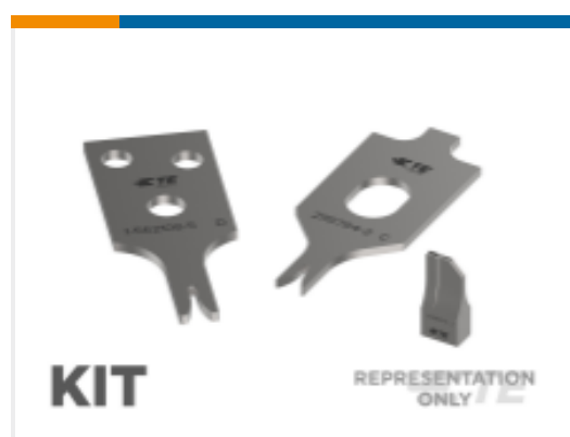
TE 产品编号7-2836378-7 OC-191F220F-CRIMPTOOLINGKIT