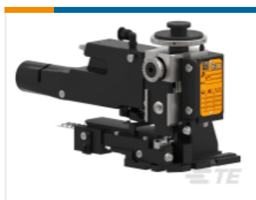
TE 产品编号2836627-2 OCEAN-2.0-APPLICATOR-S-63F94FA