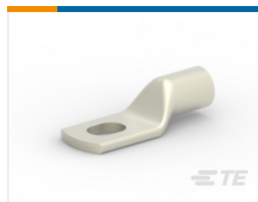
TE 产品编号3-2177380-2 RING TONGUE, CONTACT