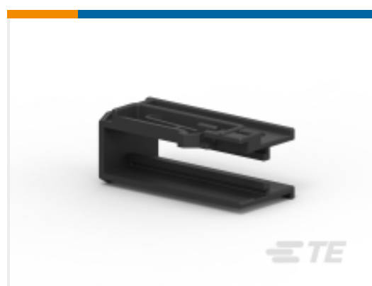
TE 产品编号2282014-1 RETAINER