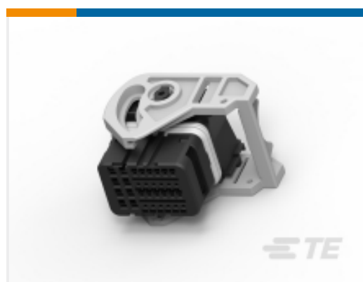
TE 产品编号1-2177515-7 32POS, MIXED,REC HSG,ASSY, SEALED