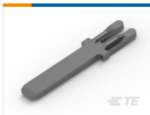
TE 产品编号2336813-2 TAB 2,8X0,8 ACT PIN