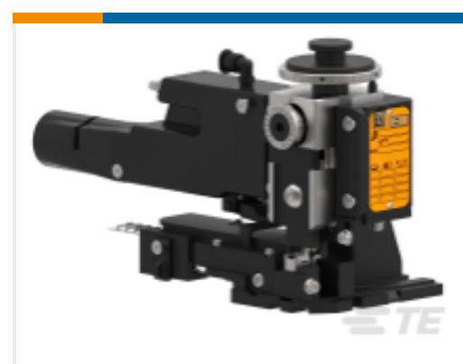
TE 产品编号2837141-2 OCEAN-2.0-APPLICATOR-S- 160F190OVA