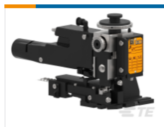
TE 产品编号2836378-2 OC-AT-S-FA-191F220F-034-0802