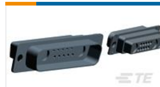
TE 产品编号208810-2 PLUG ASSY,COAX MIX,AMPLIMITE