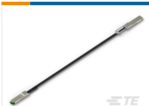
TE 产品编号2333393-3 30 AWG QSFP28 对 QSFP28 电缆组件