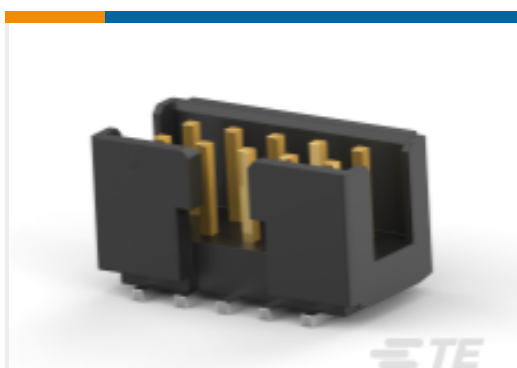
TE 产品编号1-2373376-0 10P,2MM,SHRD HDR,DRVT,SMD,0.1 AU,TB