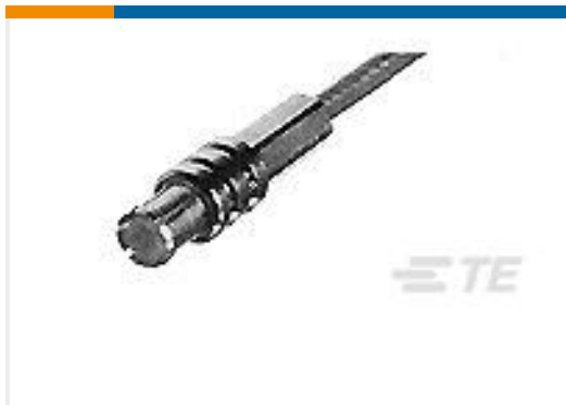
TE 产品编号1060875-2 MCX CABLE PLUG, CRIMP ATTACH