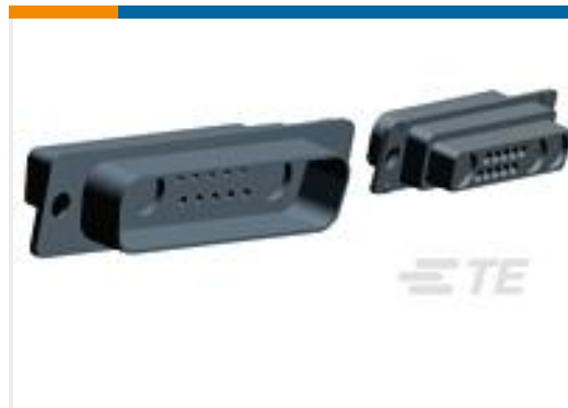
TE 产品编号208810-2 PLUG ASSY,COAX MIX,AMPLIMITE