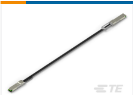
TE 产品编号2333393-3 30 AWG QSFP28 对 QSFP28 电缆组件