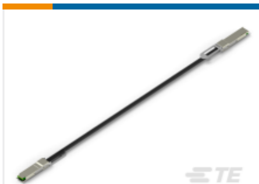
TE 产品编号2333393-3 30 AWG QSFP28 对 QSFP28 电缆组件