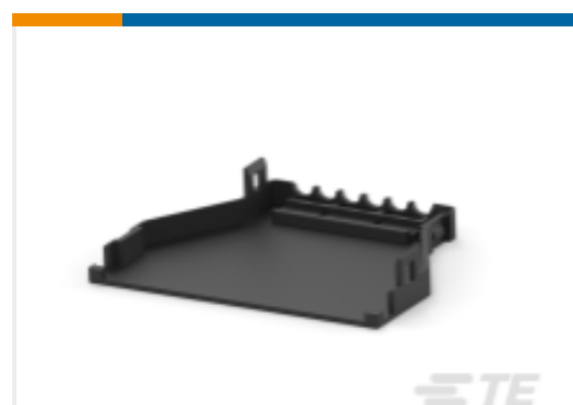
TE 产品编号1776695-1 Strain Relief, D5200, Dynamic