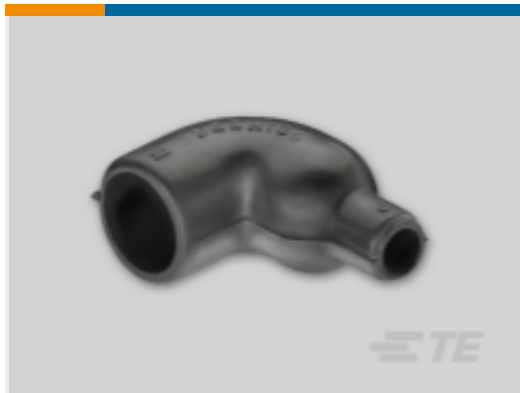
TE 产品编号806823-000 球形热缩护套：有嘴，直角