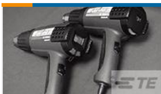
TE 产品编号 CJ2087-000 HL2010E-KIT-120V