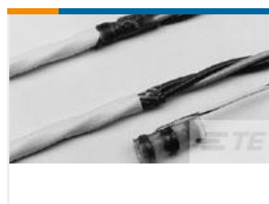
TE 产品编号C88166-000 S200-1-W1-22-9