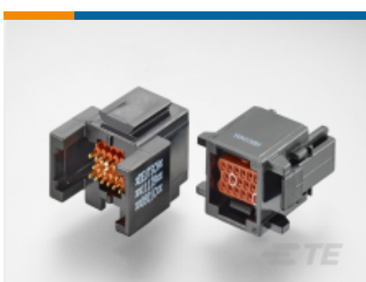
TE 产品编号ABC06N-22P IN-LINE PLUG