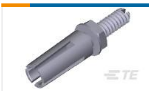
TE 产品编号202512-1 COR. GUIDE SOCKET ASSY.