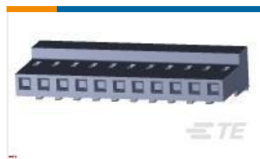
TE 产品编号4-640431-1 11P MTA156 CONN ASSY 18AWG ORA