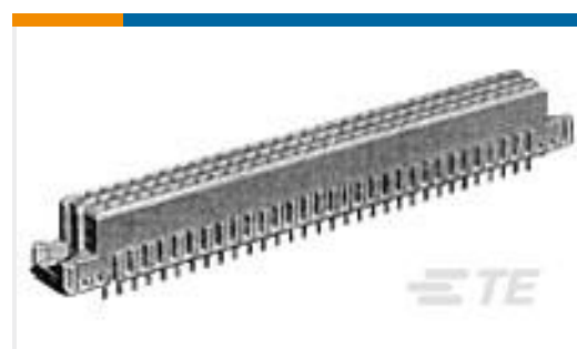
TE 产品编号535097-5 120 EURO TYPE C RECEPT ST ASSY