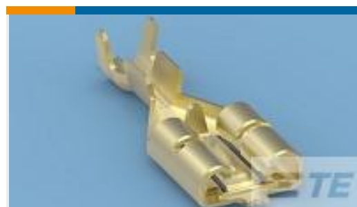
TE 产品编号1380088-1 PL MKIII L.I.F 250 REC 0.5/1.0 MM2 BR