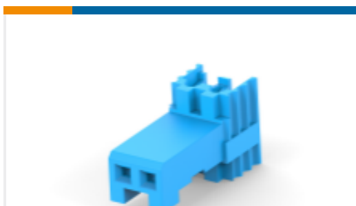
TE 产品编号144270-4 HE13/HE14 IDC 母端, SRRA, AWG24