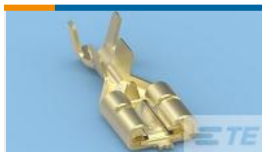
TE 产品编号1380089-1 PL MKIII L.I.F 250 REC>1.0/2.5 MM2 BR