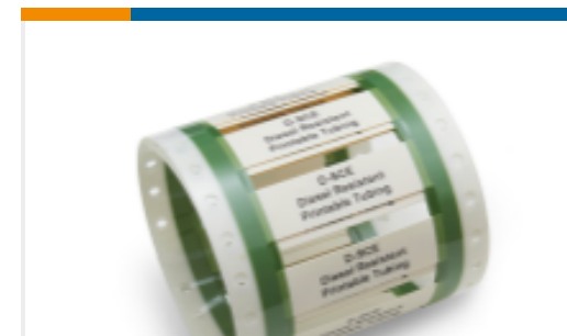
TE 产品编号 5492670001 D-SCE-9.5-50-S1-4