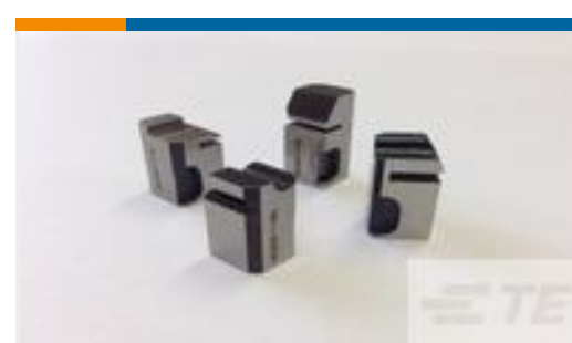
TE 产品编号 2-454276-4 FLOATING SHEAR