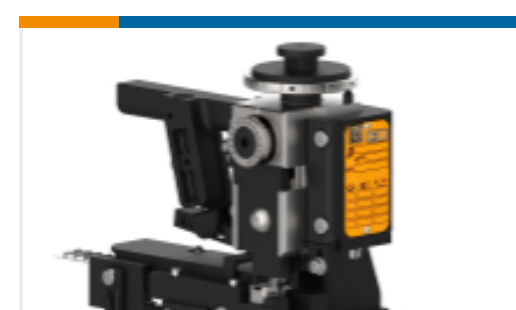
TE 产品编号 2836063-1 OCEAN-2.0-APPLICATOR-S-074F083F