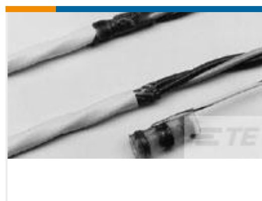
TE 产品编号C88166-000 S200-1-W1-22-9