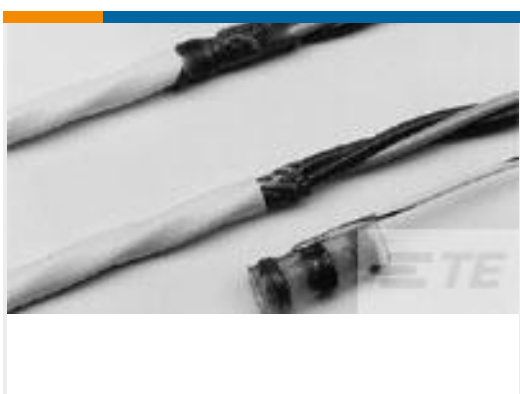
TE 产品编号 A74731-000 S200-2-W1-22-9