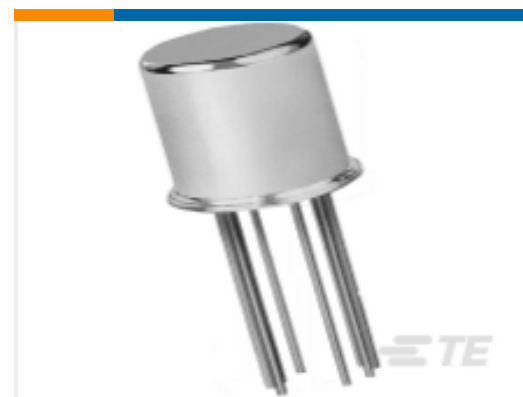
TE 产品编号1617169-2 JMSWDD-18XP = M39016/21-011P