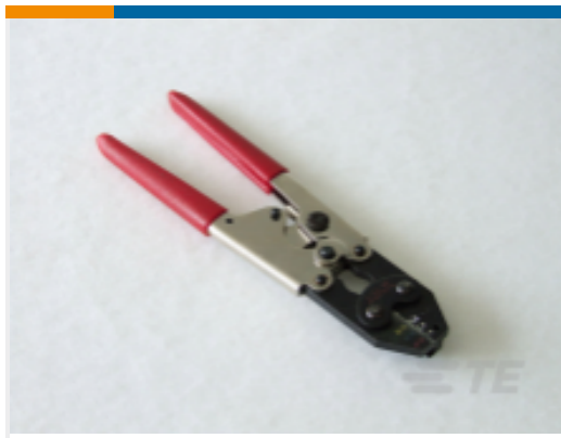
TE 产品编号 992008-000 AD-1377-CRIMP-TOOL-3-CVTY