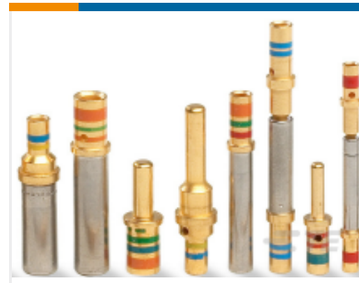
TE 产品编号100505L CONT SOC ASSY