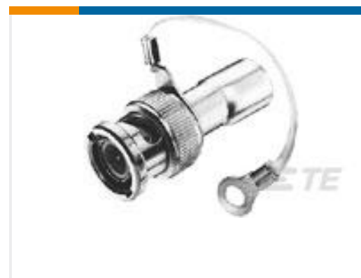
TE 产品编号221629-1 TERMINATOR,BNC,50 OHM,1 WATT