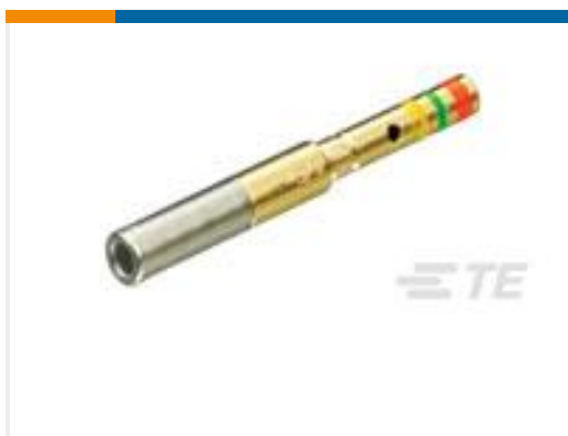
TE 产品编号38946-22 CONTACTS (=724-0003-22)