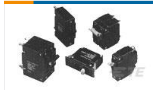
TE 产品编号 2-1393254-8 W91-X112-30=M6/M7/M9/W6/W7