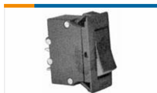
TE 产品编号 3-1423673-9 W51-A152A1-5=CKTBKR,THERM,ROC