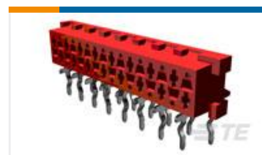
TE 产品编号 215460-4 MICRO-MATCH FEM.SE