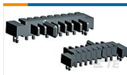
TE 产品编号 1827654-2 2mm pitch Battery Plug Assy. 7P. H=4.0