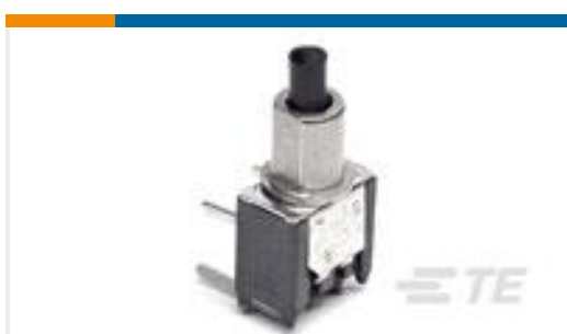
TE 产品编号 1825095-2 TP11CGPC204