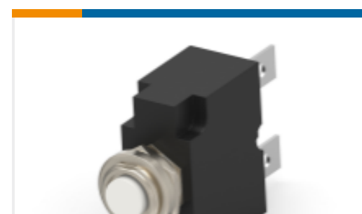
TE 产品编号 1423675-6 W57-XB7A4A10-8=CKTBKR,THERM,PB