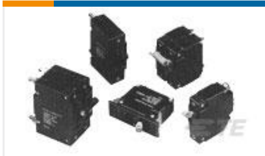
TE 产品编号 1-1393254-9 W91-X1110-30=M6/M7/M9/W6/W7/W9