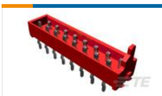
TE 产品编号 7-215464-4 04P.MICRO-MATCH MOB