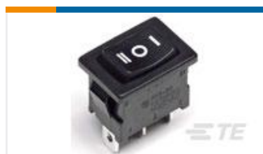
TE 产品编号 1571079-4 PRASD1-16F-BB000=POWER ROCKER