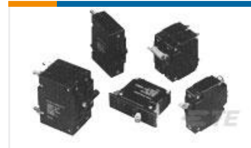
TE 产品编号 4-1393254-6 W91-X152-30=M6/M7/M9/W6/W7