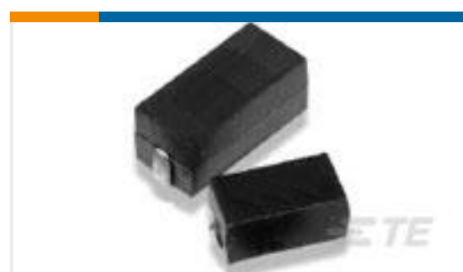
TE 产品编号 1879234-7 SMF5 910R 5%