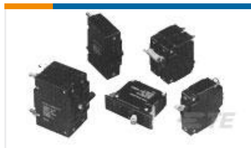
TE 产品编号 2-1393254-8 W91-X112-30=M6/M7/M9/W6/W7