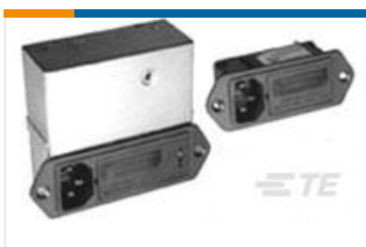
TE 产品编号2-6609128-8 6VM1S=F8096