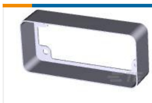
TE 产品编号202119-2 PIN HOOD