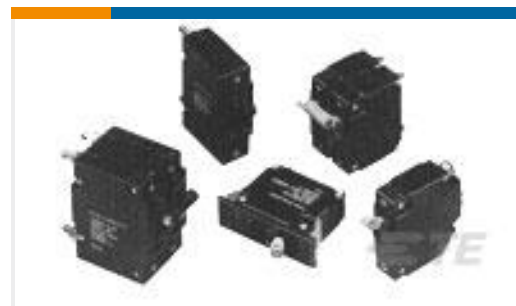
TE 产品编号 4-1393254-6 W91-X152-30=M6/M7/M9/W6/W7