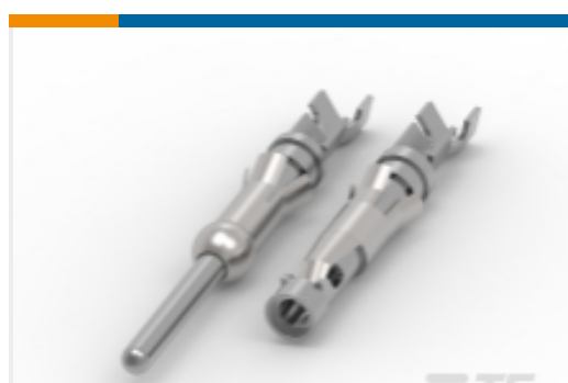
TE 产品编号1-66105-9 类型 III 端子低型面