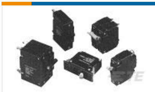
TE 产品编号 5-1393254-5 W91-X252-30=M6/M7/M9/W6/W7