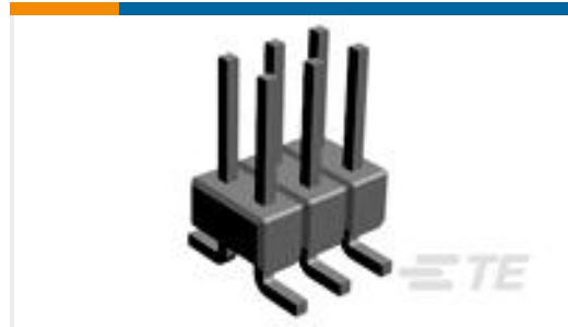
TE 产品编号1241050-3 2x3P MOD II BREAK AWAY HDR,SMD, BLISTER