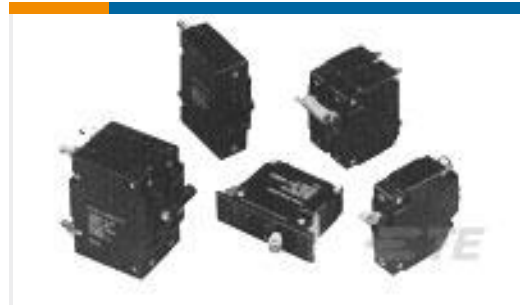
TE 产品编号 2-1393254-9 W91-X112-40=M6/M7/M9/W6/W7