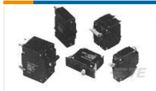
TE 产品编号 4-1393254-7 W91-X152-35=M6/M7/M9/W6/W7