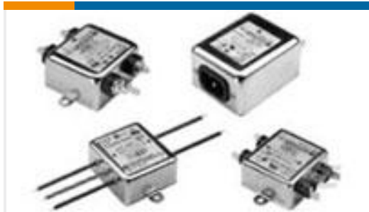
TE 产品编号2-6609028-0 30VK6=F7358 S0