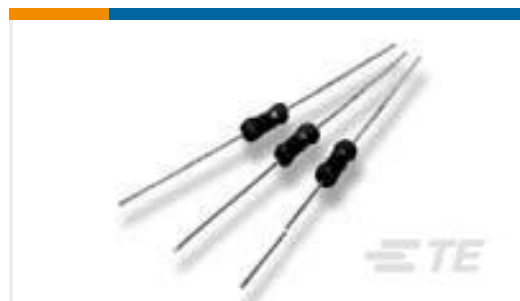
TE 产品编号1-1625892-9 3W SM M/OX 5% 180R