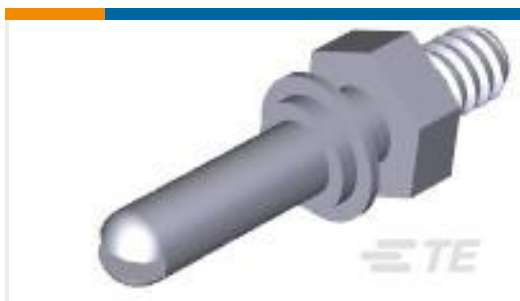
TE 产品编号1-201046-2 SERIES "M" MIN RECT GUIDE PIN