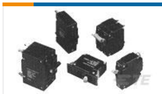
TE 产品编号2-1393254-9 W91-X112-40=M6/M7/M9/W6/W7