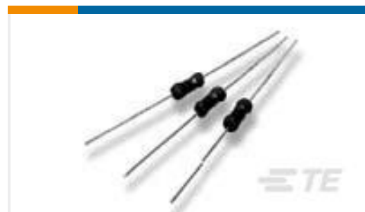
TE 产品编号2-1879352-5 RR02 5% 3R3 AMMO