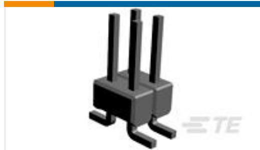
TE 产品编号1241050-2 2x2P MOD II BREAK AWAY HDR,SMD, BLISTER