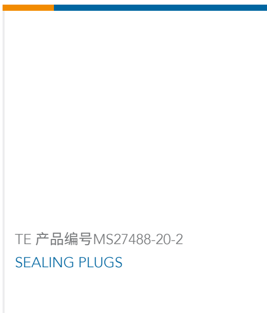
TE 产品编号MS27488-20-2 SEALING PLUGS