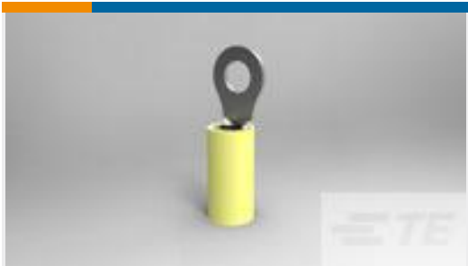
TE 产品编号 2-36161-3 TERMINAL,PIDG R IR 12 10