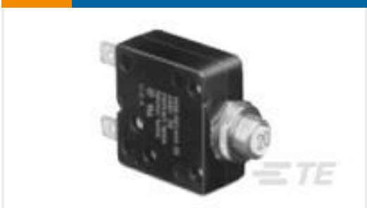
TE 产品编号1-1393249-2 W58-XB1A4A-20=W58