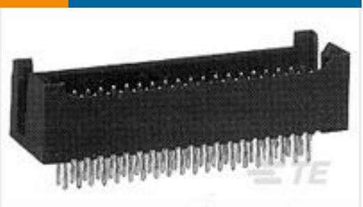
TE 产品编号102567-6 50 MODII 2PC HDR DR SHRD .100