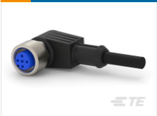
TE 产品编号1-2273089-1 M8 A 编码母端弯角单头