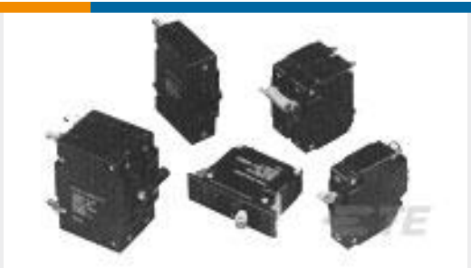
TE 产品编号 8-1393254-1 W92-X112-5=M6/M7/M9/W6/W7