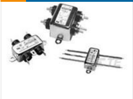
TE 产品编号1-6609021-4 30VB6=F7355 S0