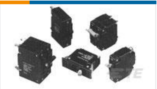
TE 产品编号 7-1393254-1 W92-X112-2=M6/M7/M9/W6/W7