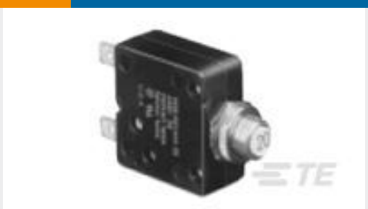
TE 产品编号1-1393249-6 W58-XB1A4A-30=W58