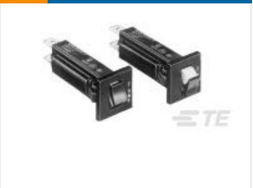
TE 产品编号1-1393250-9 W28-XQ1A-0.25=W28