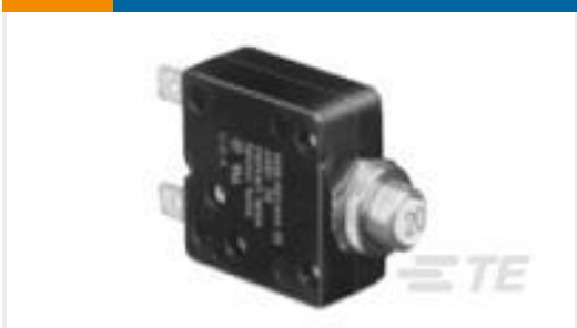
TE 产品编号1-1393249-1 W58-XB1A4A-2=W58