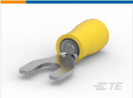
TE 产品编号 8-32589-2 TERMINAL,PIDG SPD 12-10 10