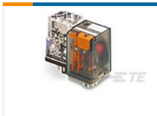
TE 产品编号1-1393105-2 KRPA-11AG-24=RELAY,GENPUR, OCTA