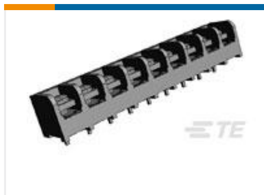
TE 产品编号2-1437653-5 6PCV-09-006=6PCV ASSEMBLY