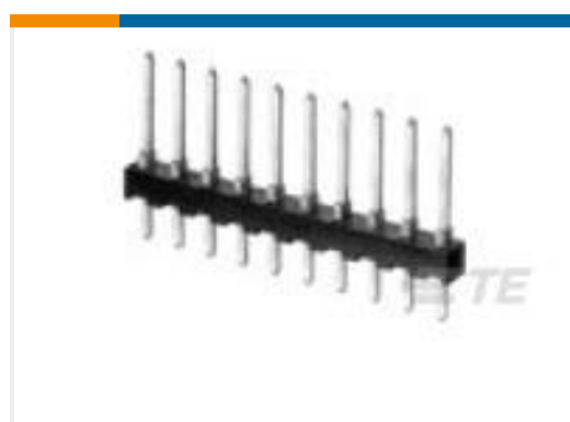
TE 产品编号1-87224-6 16 MODII HDR SRST UNSHRD .100