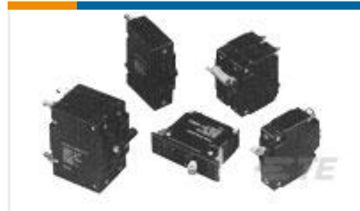
TE 产品编号 4-1393254-9 W91-X152-5=M6/M7/M9/W6/W7