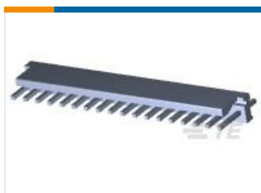
TE 产品编号1-644752-8 18P MTA156 HDR ASSY SQ STR F/L