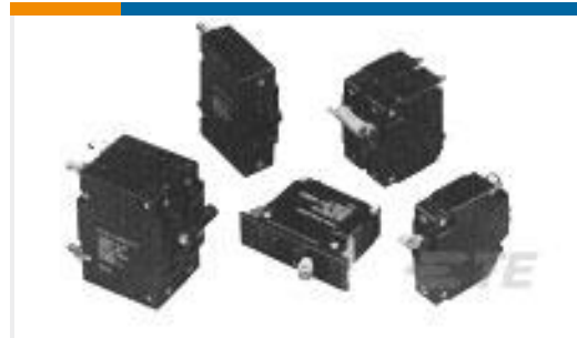
TE 产品编号 3-1393254-0 W91-X112-5=M6/M7/M9/W6/W7