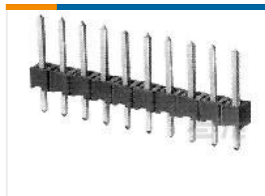
TE 产品编号103327-4 04 MODII HDR SRST B/A .100CL