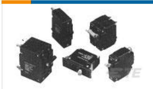
TE 产品编号 4-1393254-0 W91-X150-5=M6/M7/M9/W6/W7