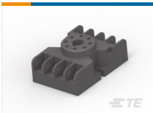
TE 产品编号1393143-6 27E122=SOCKET,KRP,8,SCW,PLES