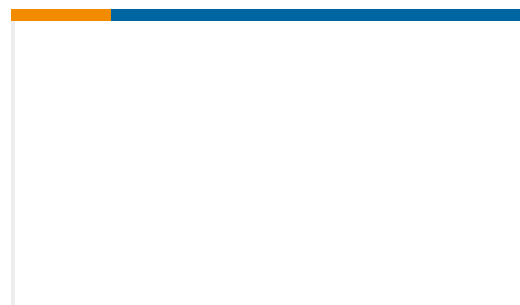
TE 产品编号NB08762001 ATUM-9/3-X-STK