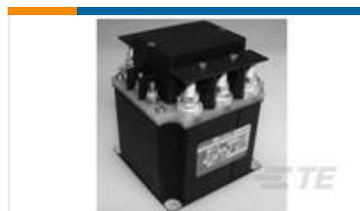
TE 产品编号1616021-6 SA136A=CONTACTOR 3PST N.O. 75