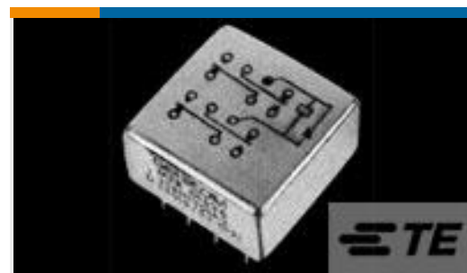
TE 产品编号2-1617076-5 3SBH1230A2 = M39016/53-011M