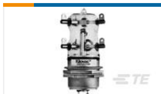
TE 产品编号1-1618273-5 H-16C=RELAY, VACUUM, DPDT