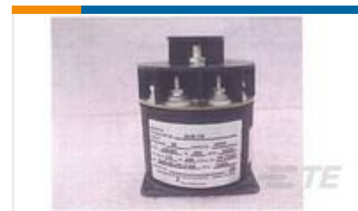
TE 产品编号1-1616037-6 DHR7B=CONTACTOR - 3PDT