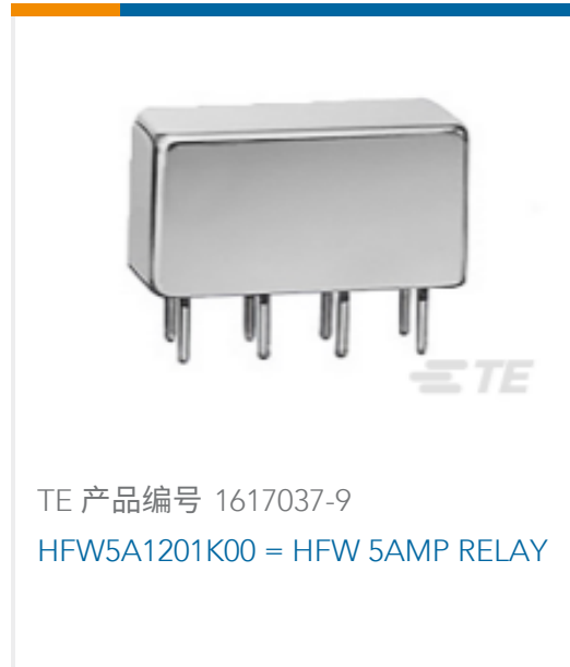
TE 产品编号 1617037-9 HFW5A1201K00 = HFW 5AMP RELAY