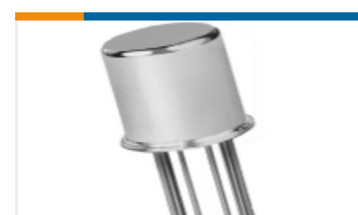
TE 产品编号1617164-7 JMACT-5XL = M28776/1-025L