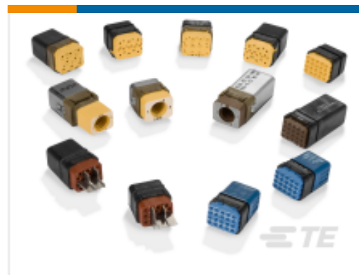
TE 产品编号ZPF000000000163975 DMC-M 99-04 CN (=33537-PC000)