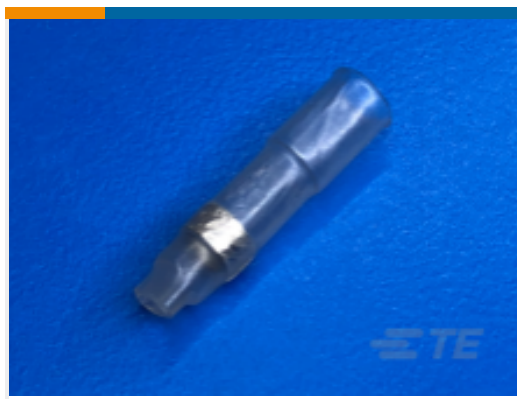
TE 产品编号F78598-000 B-155-1504