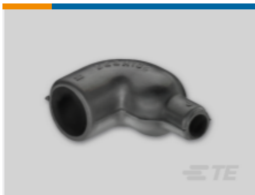
TE 产品编号 806823-000 球形热缩护套：有嘴，直角