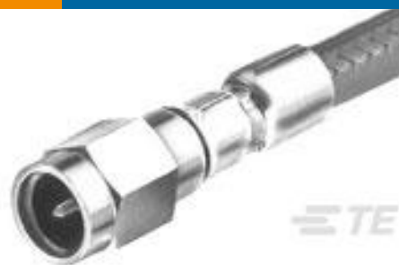
TE 产品编号221117-2 KIT, COMMERCIAL SMA PLUG ASSY