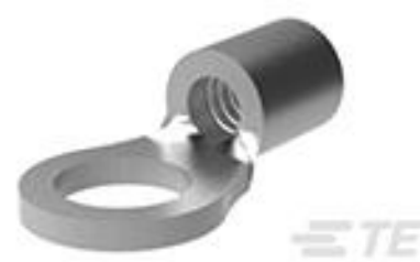
TE 产品编号34104-6 SOLIS R 22-16 4 NIPL