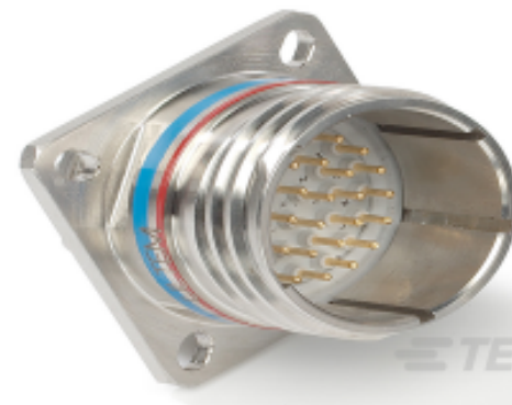
TE 产品编号YDTS20W09-35PBV001 RECP ASSY