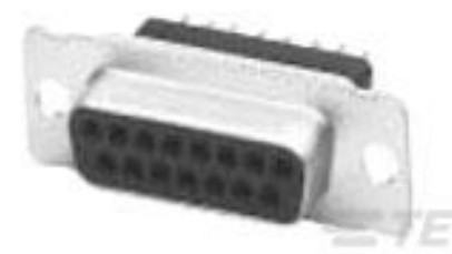
TE 产品编号747190-1 09 RCPT SP/MS CNUT