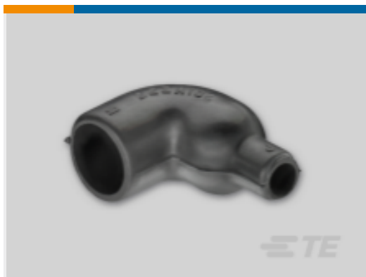
TE 产品编号806823-000 球形热缩护套：有嘴，直角