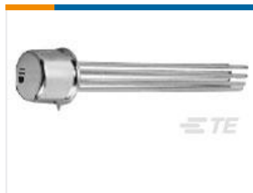
TE 产品编号 1617165-1 JMAWDD-12XP = M39016/20-010P