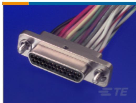
TE 产品编号 2-1532179-4 M83513/03-A08C, MCKS-C2-B-9P5L5-1.0