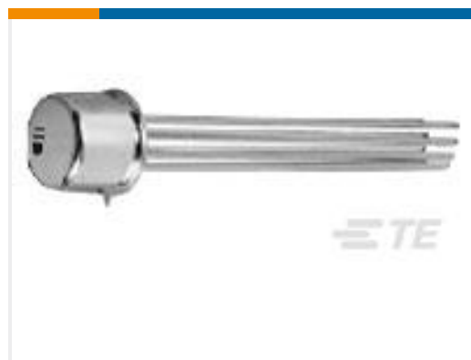
TE 产品编号 5-1617568-5 JMAWD-6XP=M39016/15-029P