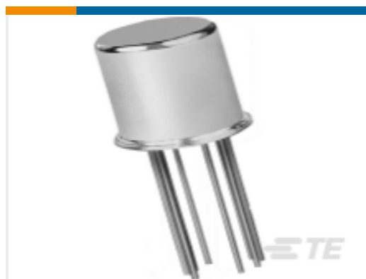
TE 产品编号 8-1617568-0 JM5C-48XL=M39016/11-038L