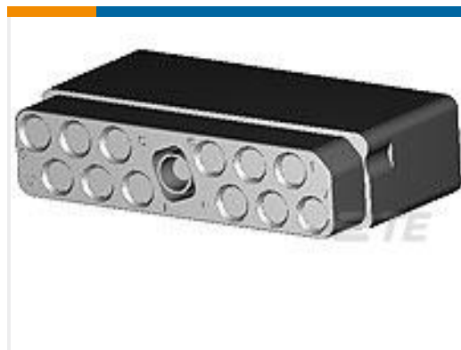
TE 产品编号 1604800-8 ASSY,PLUG,FREE HANGING,12 POS, W/HDWE