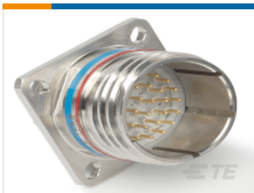
TE 产品编号 YDTS20W25-29ADV001 RECP ASSY