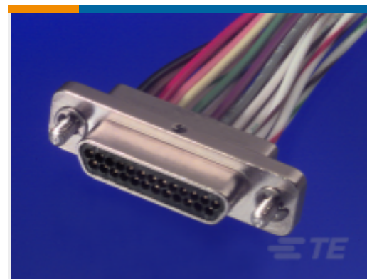
TE 产品编号 2-1532186-9 M83513/03-H12C, MCKS-C2-B-100P6Q9-36.0