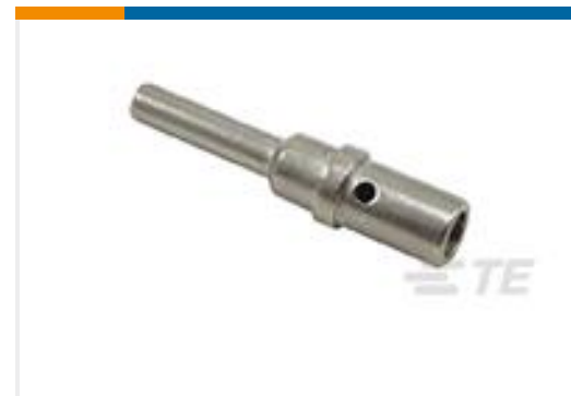
TE 产品编号0460-204-12141 PIN, SOLID, SIZE 12, 12-14AWG, NI