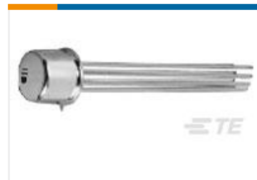
TE 产品编号2-1617119-5 J1MSC-12XM = M39016/10-035M