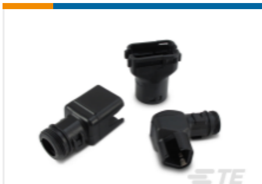
TE 产品编号1011-269-0605 DEUTSCH DT 后盖