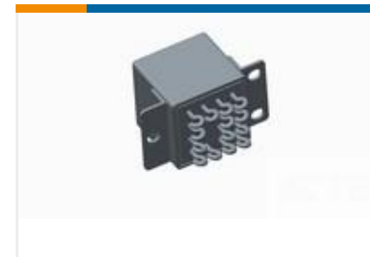
TE 产品编号1-1617805-7 TD228-1001S=TDFO 1SEC M83726/28-1001S