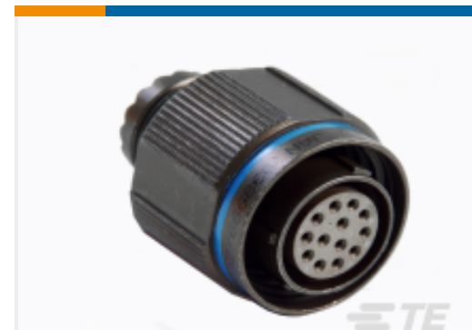
TE 产品编号YDTS26Z09-98SAV001 PLUG ASSY