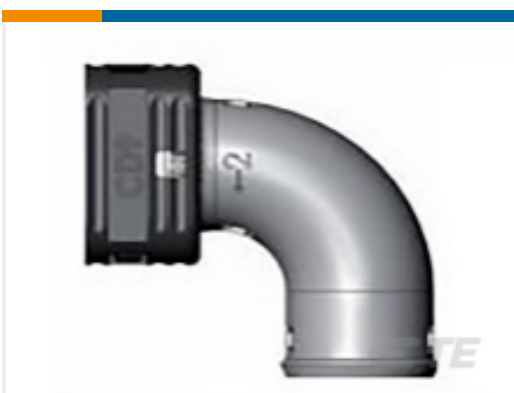
TE 产品编号ZPF00000000102764 787-8055-30M