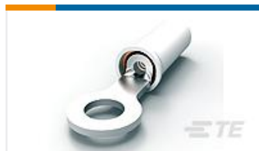
TE 产品编号150493 PIDG, RING, 24-20 4