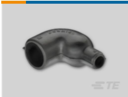
TE 产品编号806823-000 球形热缩护套：有嘴，直角