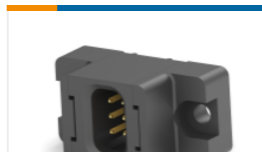
TE 产品编号6651777-1 CONNECTOR, PIN, STRAIGHT, COMPLIANT,FLA