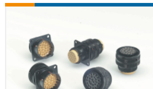
TE 产品编号ZPF000000000100155 FDBA 57-12-3 SN-K 090 A838