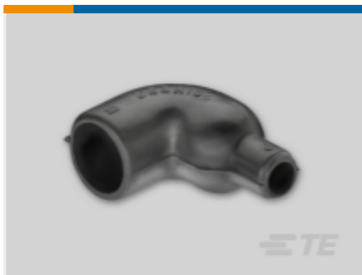
TE 产品编号806823-000 球形热缩护套：有嘴，直角