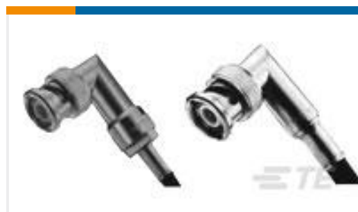
TE 产品编号225973-4 PLUG, RT ANGLE, DUAL CRIMP, BNC