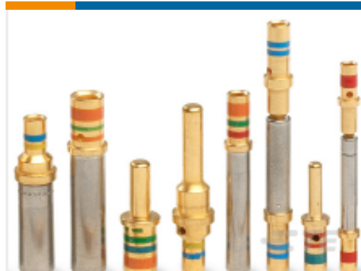
TE 产品编号1662-213-2031 CONT SOC ASSY