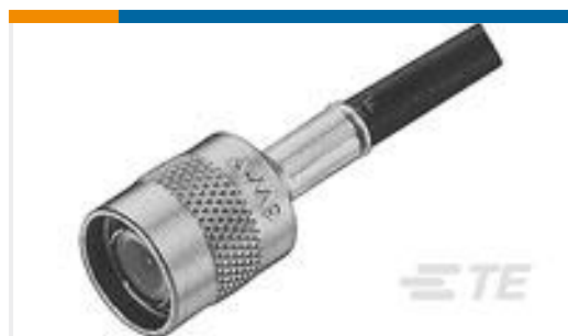
TE 产品编号225550-6 TNC PLUG DUAL W/P