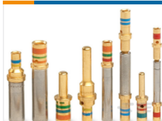
TE 产品编号ZPF000000000001203 097-0016-20