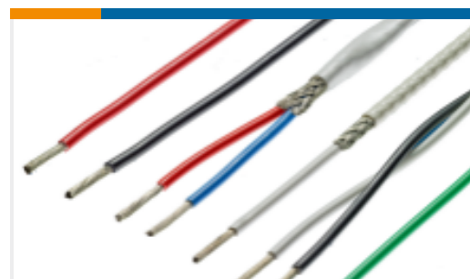
TE 产品编号245409-000 44A0131-22-9/93/96CS2275