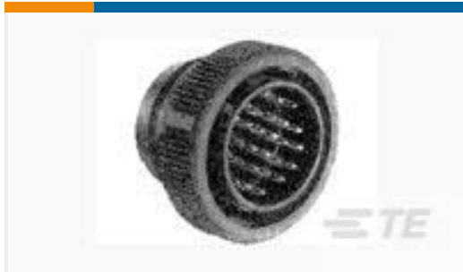
TE 产品编号206039-1 CPC PLUG ASSEMBLY SIZE 17-28