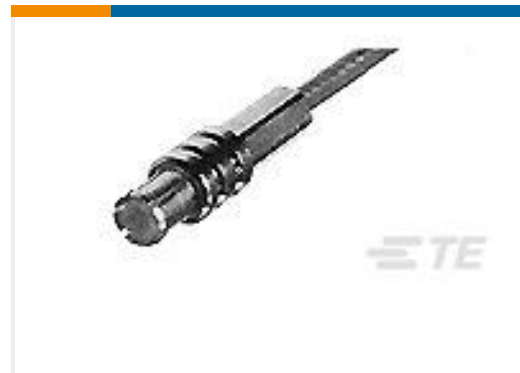
TE 产品编号1060875-2 MCX CABLE PLUG, CRIMP ATTACH