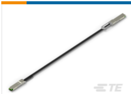
TE 产品编号2333393-3 30 AWG QSFP28 对 QSFP28 电缆组件