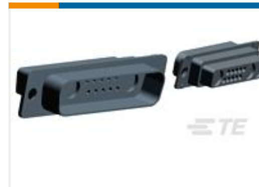
TE 产品编号208810-2 PLUG ASSY,COAX MIX,AMPLIMITE