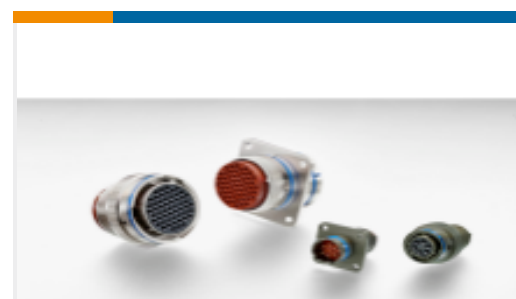
TE 产品编号 YAFD50-18-32SNC012 RECP ASSY