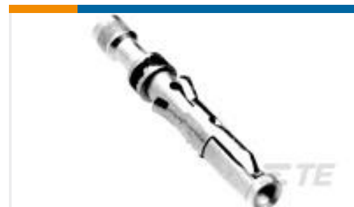
TE 产品编号 201580-1 SKT CONT ASSY,TYPE II