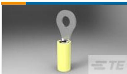
TE 产品编号 35149 TERMINAL,PIDG R 12-10 6