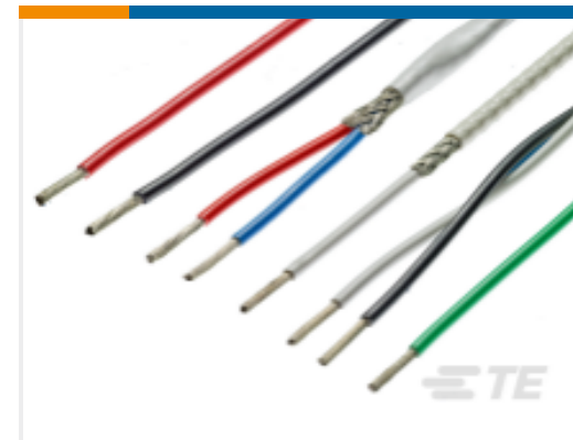
TE 产品编号 739999-000 44AM4131-20-MST3-9CS2275