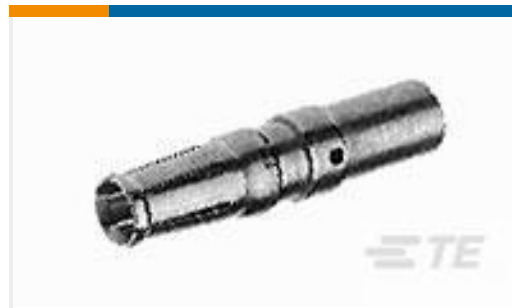
TE 产品编号 213750-1 SIZE 8 SKT CONT ASSY,8 AWG