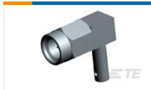
TE 产品编号 1045507-1 SSMA R/A Cable Plug 1037 5001 00