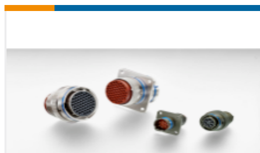
TE 产品编号 YAFD57-24-61SXC012 PLUG ASSY