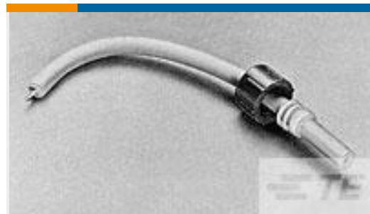
TE 产品编号 5-830611-2 LGH 1/2 MLD END LEAD ASY