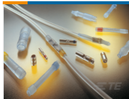
TE 产品编号 083541-000 D-436-39CS749