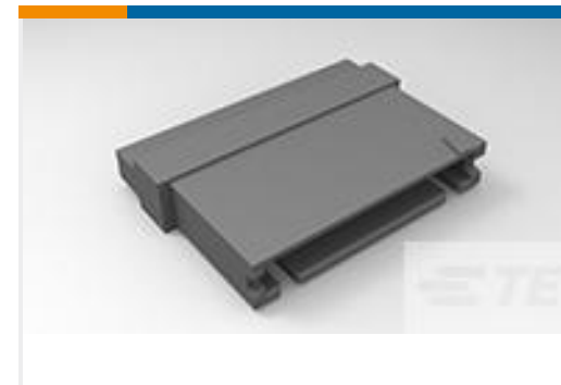
TE 产品编号 485893-8 010 HOUSING FFC PIN 100CL SR