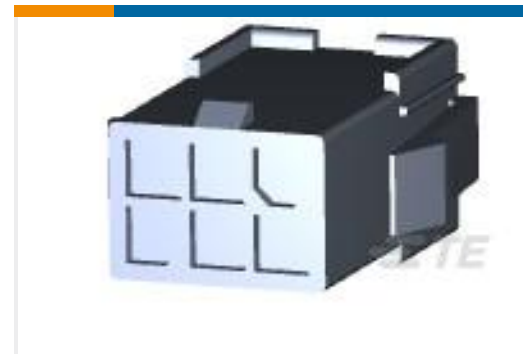
TE 产品编号 1-172160-9 MINI UNIVERSAL M-N-L CAP 6P