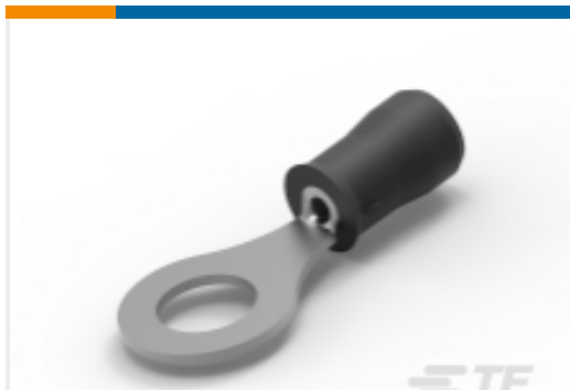
TE 产品编号 54771-1 PIDG 环形端子