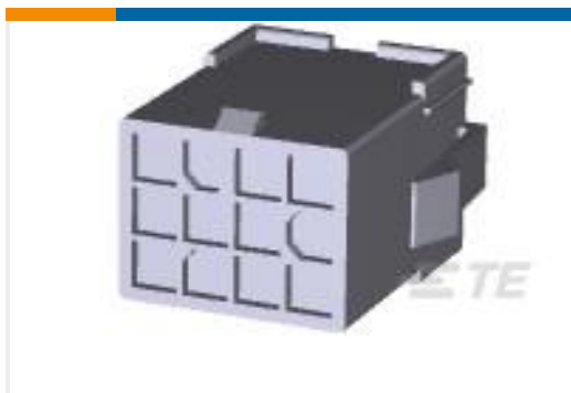
TE 产品编号 1-172162-2 12 POS TR MINI UNIV