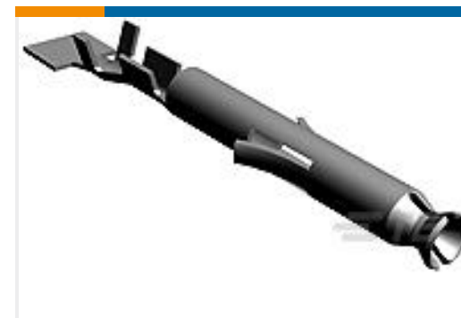
TE 产品编号 1-770834-1 MINI UMNL SOK PHBRZ AU LF