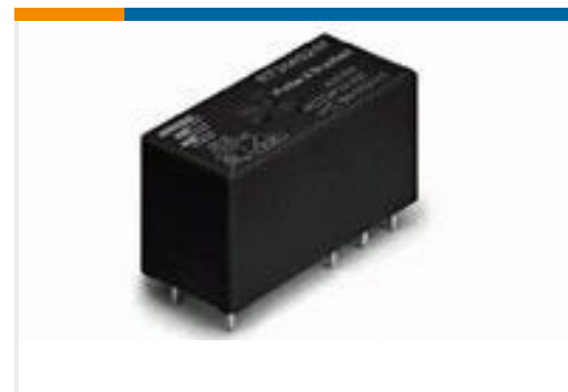
TE 产品编号 1419108-8 RT314005F