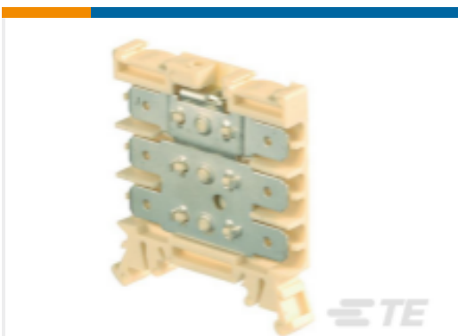
TE 产品编号1SNA190316R2700 HD2.5/6.3.3G.3G.1