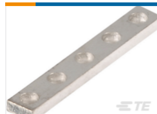
TE 产品编号1SNA168485R2700 BJS61-10