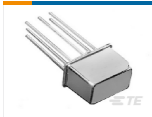
TE 产品编号1617601-4 PRMGSTG-5YW=RELAY