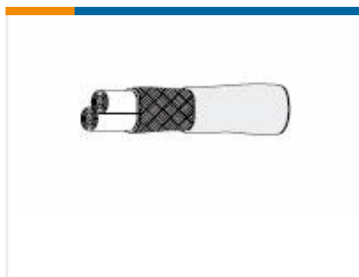
TE 产品编号542244-000 55PC1822-16-9/96-9