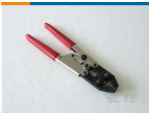
TE 产品编号 992008-000 AD-1377-CRIMP-TOOL-3-CVTY