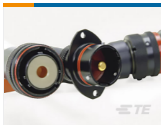
TE 产品编号ASHD022-24320SN090 RECEPT.ASSY.ASHD. 24320 PLANFORM.