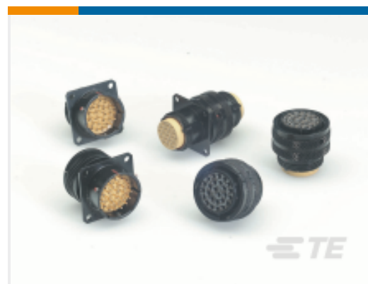
TE 产品编号ZPF00000000019072 FDBA 56-10-6 PN-K-A285