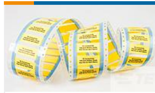
TE 产品编号3906690001 TMS-SCE-1/4-2.0-4