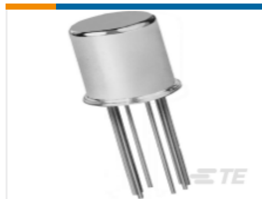
TE 产品编号1617164-7 JMACT-5XL = M28776/1-025L